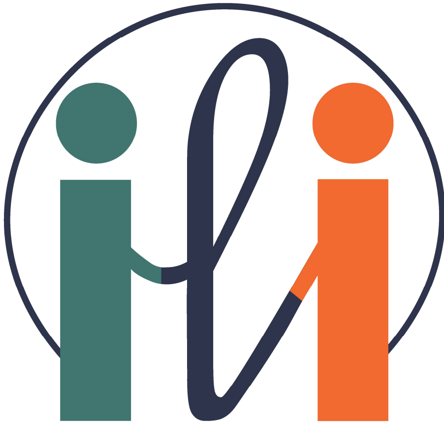
Initiatives Locales d'Intégration